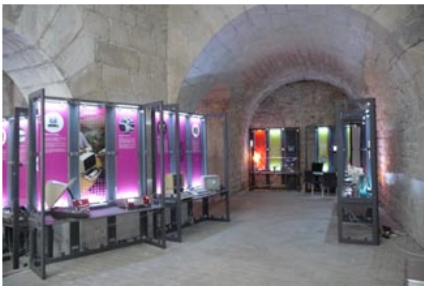
Exemple de modules d'exposition

Cette exposition s'attache en particulier à présenter l'histoire des outils dont l'homme s'est doté pour traiter l'information depuis le calcul sur les doigts jusqu'aux jeux et à l'utilisation des robots ; elle est par conséquent très adaptée à des visites pour les scolaires. Par l'actualité du thème et les supports, elle peut intéresser les élèves du cours moyen jusqu'au lycée ; chaque professeur est à même d'enrichir la visite avec son expérience selon le niveau concerné. Pour répondre à vos besoins, des idées d'ateliers peuvent vous être suggérées par l'association sur demande (voir p.9).