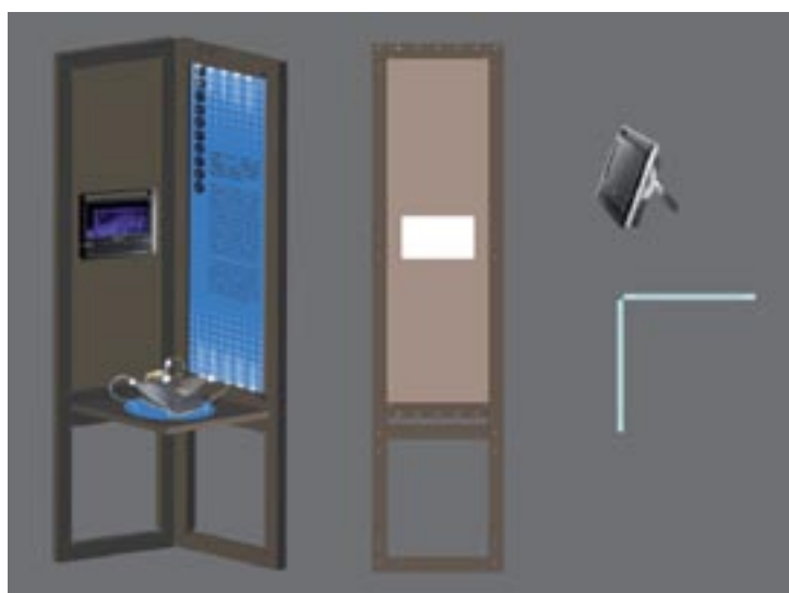
Exemple de module vidéo