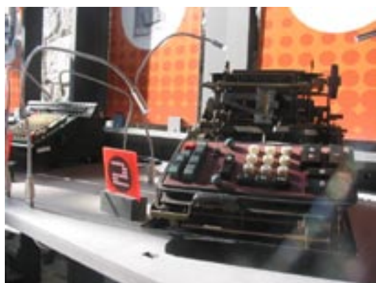
Exemple d'objet exposé

Les objets présentés dans l'exposition sont la propriété de l'association ACONIT. Ils vous sont également loués avec l'exposition bien évidemment. On en compte environ 90, petit aperçu de notre collection, l'une des plus belles d'Europe dans ce domaine !