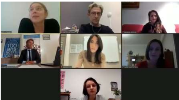
Figure 6 : Capture d'écran du partage d'expérience 1 : « Comment créer du lien entre les sciences et les citoyens de demain ? »