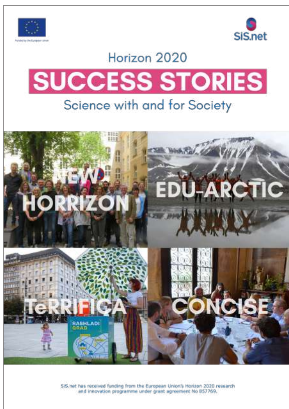
Figure 11 : Couverture du booklet qui regroupe 4 success stories de projets issus de Horizon 2020

L'Amcsti a également mené des actions directes pour le réseau SiS.net :