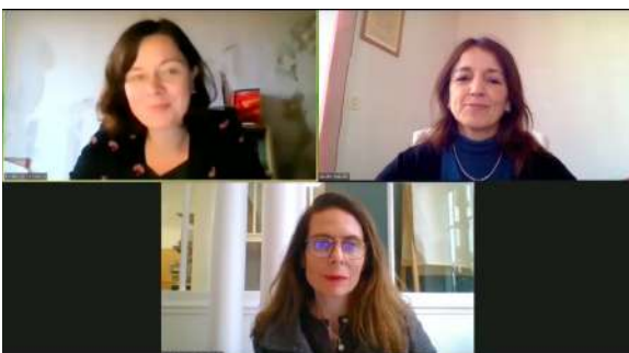
Figure 7 : Capture d'écran de la restitution d'étude : « Le rôle du livre dans les organisations de médiation scientifique »

événement a réussi à trouver un public au-delà du public attendu. Depuis, trois structures non adhérentes ayant assisté à l'événement de « La nouvelle donne de la CSTI » ont adhéré à l'Amcsti.