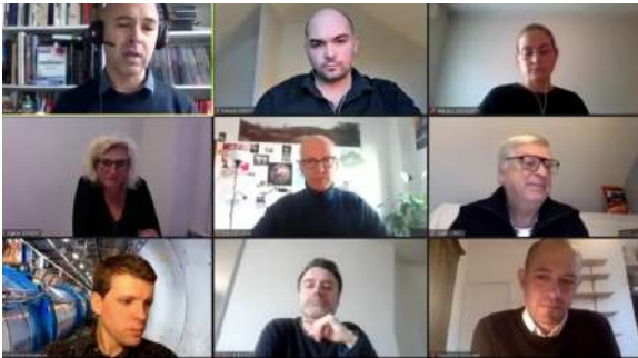
Figure 5 : Capture d'écran de la table ronde 3 : « Sciences et médias – interactions, subordination, collusion ? »