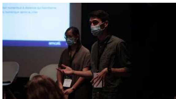
Figure 2 : L'équipe de l'Amcsti lors de la rencontre du Club MEDIation à Cap Sciences