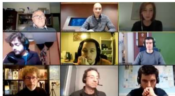
Figure 14 : Capture d'écran de la session des Connecteurs lors de « La nouvelle donne de la CSTI »

170 spectateurs ont participé à ce partage d'expériences.