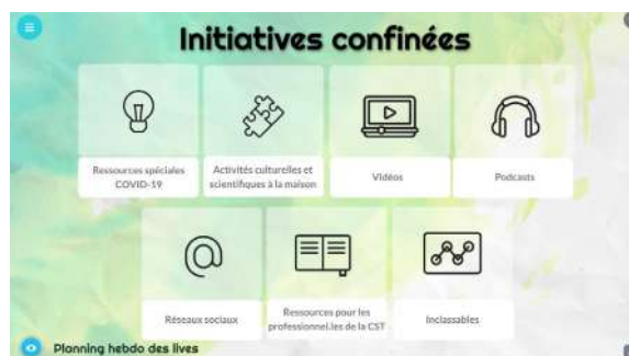
Figure 1 : Capture d'écran de la plateforme interactive Genial.ly

Par ailleurs, à l'occasion de la sortie de la Lettre de l'Ocim n°193 : Réseaux de professionnels et d'amis face au(x) confinement(s), Participatif au musée , l'Amcsti a rédigé un article dans la rubrique Covid-19 : confinement n°2 .