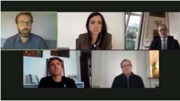
Figure 4 : Capture d'écran de la table ronde 1 : « Urgences sociétales et réalités de la science »