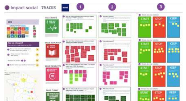
Figure 8 : Exemple de livrable (réalisé sur app. mural.co) envoyé aux participant-e-s à l'issue de l'atelier « L'impact des acteurs de la CSTI »

À la fin de chaque atelier, des livrables des productions étaient envoyés aux participant-e-s.