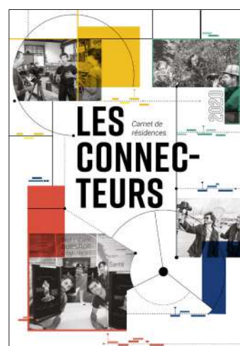
Figure 15 : Couverture du Carnet de résidences des Connecteurs

Ce carnet a été édité en 350 exemplaires et distribué dans le réseau de l'Amcsti et de la Fondation groupe EDF.