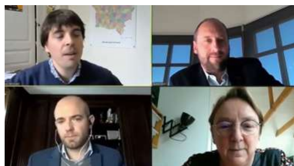
Figure 9 : Capture d'écran de la table ronde 2 : « Les CSTI dans les politiques territoriales »

La diversité des formats proposés sur ces quatre jours a été appréciée, néanmoins, certain·e·s répondant·e·s mentionnent avoir été distrait·e·s par le format numérique et l'aspect moins convivial qu'une rencontre en présentiel.