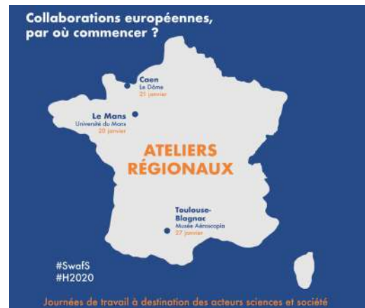
Figure 10 : Visuel des ateliers régionaux « Collaborations européennes, par où commencer ? »

Ces journées d'échanges ont permis d'explorer les bénéfices liés aux collaborations européennes, de proposer des outils facilitant la mise en place de réseaux, de partenariats et de projets internationaux, ainsi que d'identifier les éléments-clés pour réussir ce type de projets.